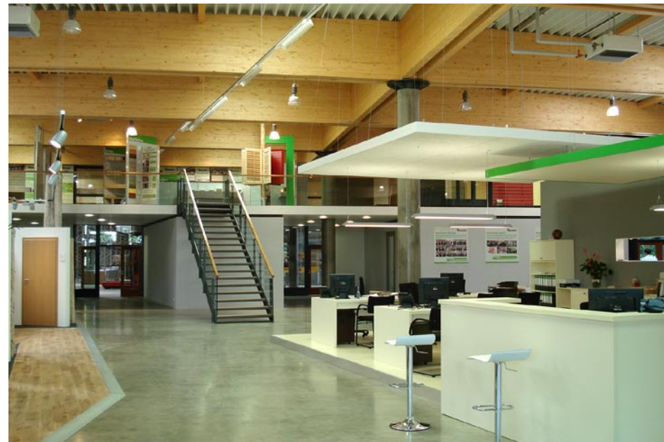
Verkauf / Ausstellung