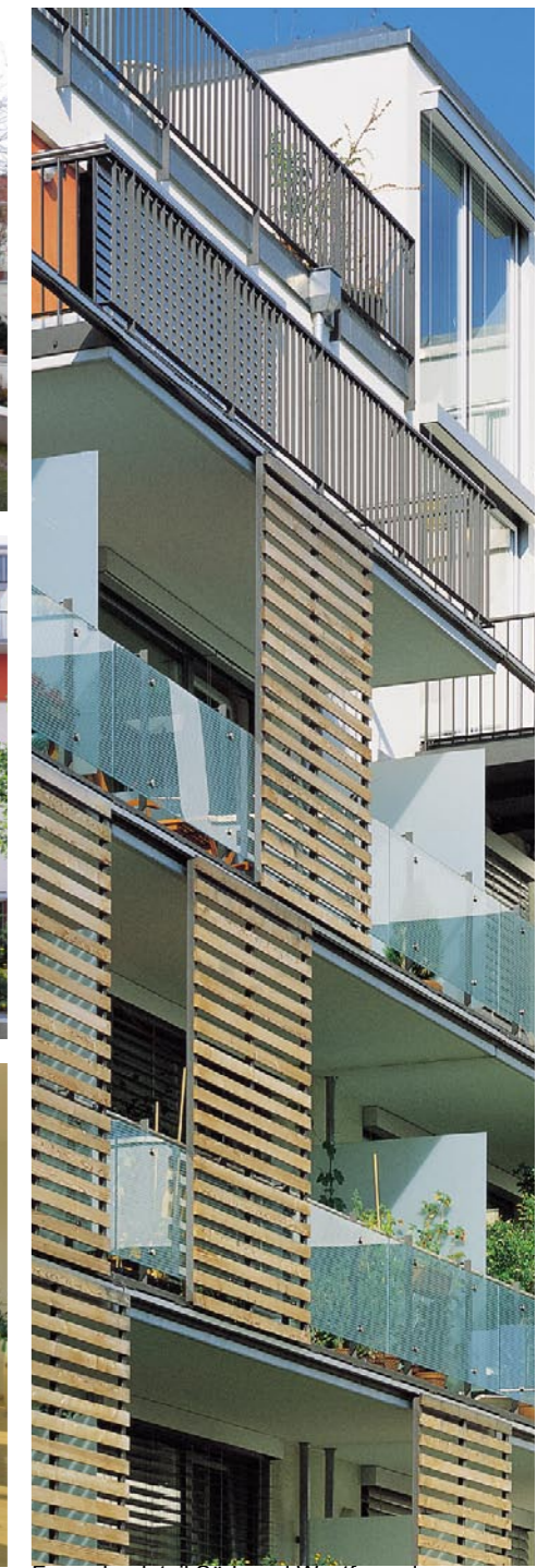
Fassadendetail Süd- und Westfassaden