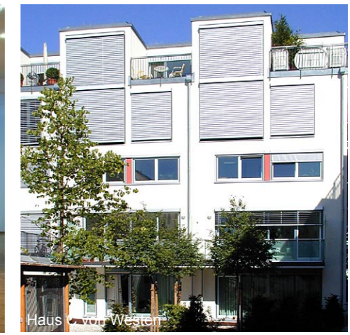
Haus C von Westen