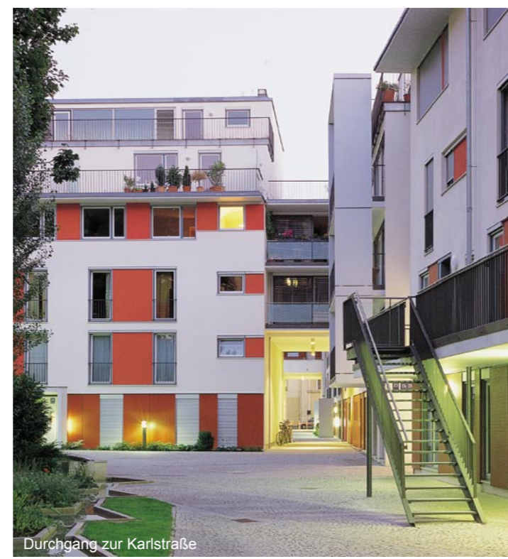
Durchgang zur Karlstraße