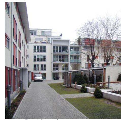
Häuser F und C von Osten