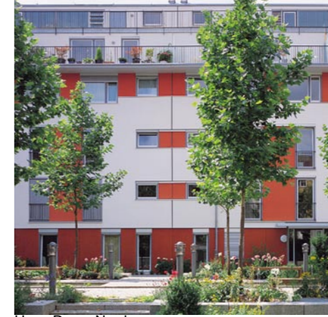
Haus D von Norden