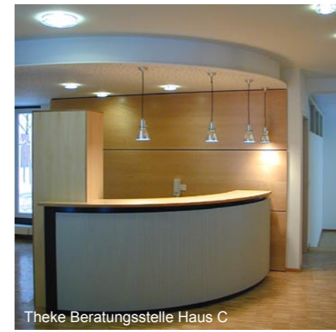
Theke Beratungsstelle Haus C