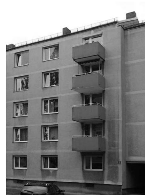
Straßenansicht vor und nach dem Umbau