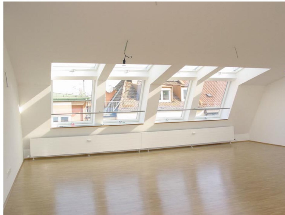
Wohnung im DG