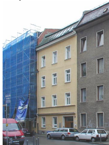
Vor dem Umbau