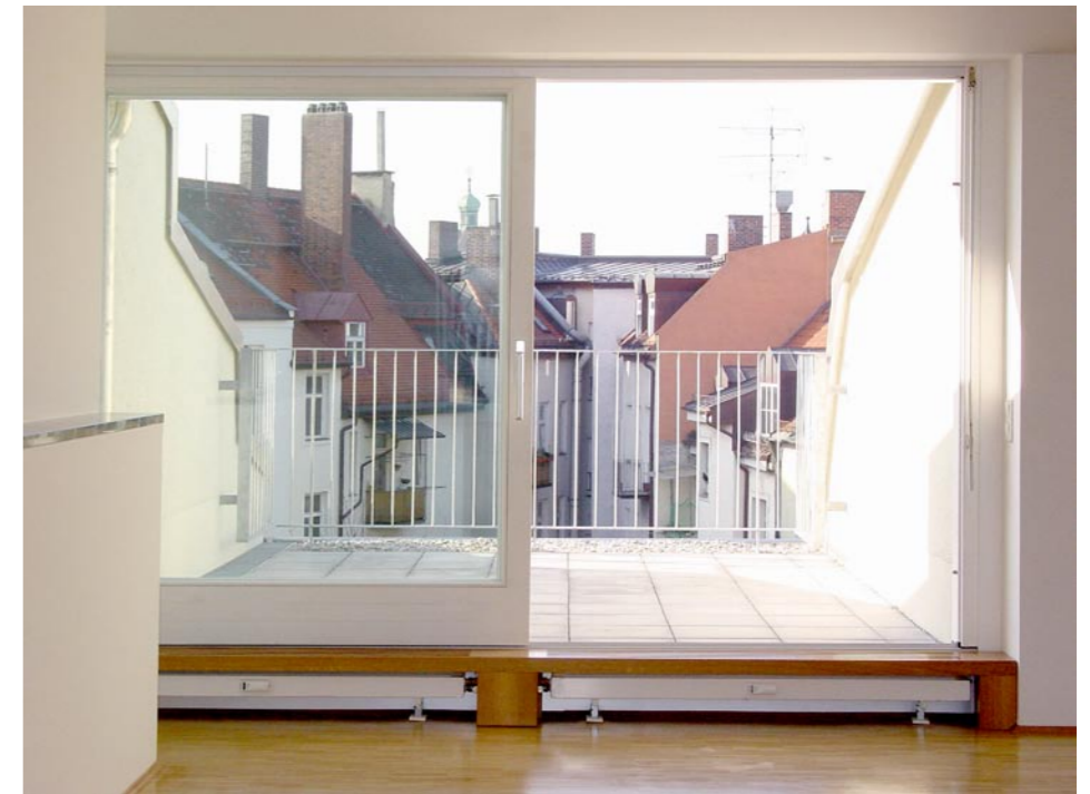
Wohnung im DG