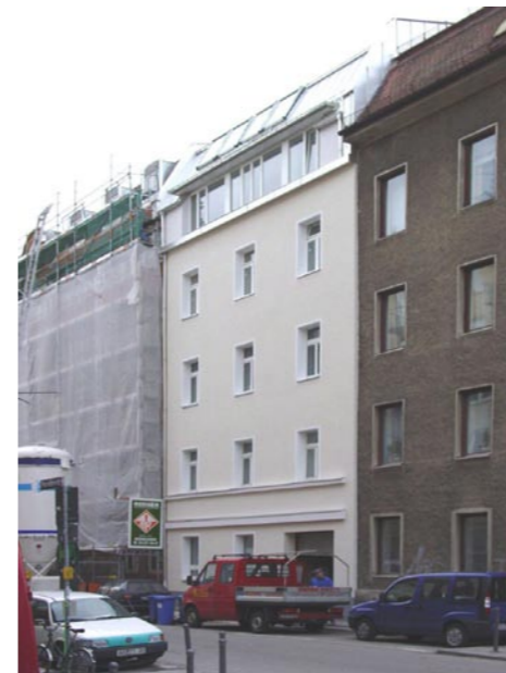
Nach dem Umbau